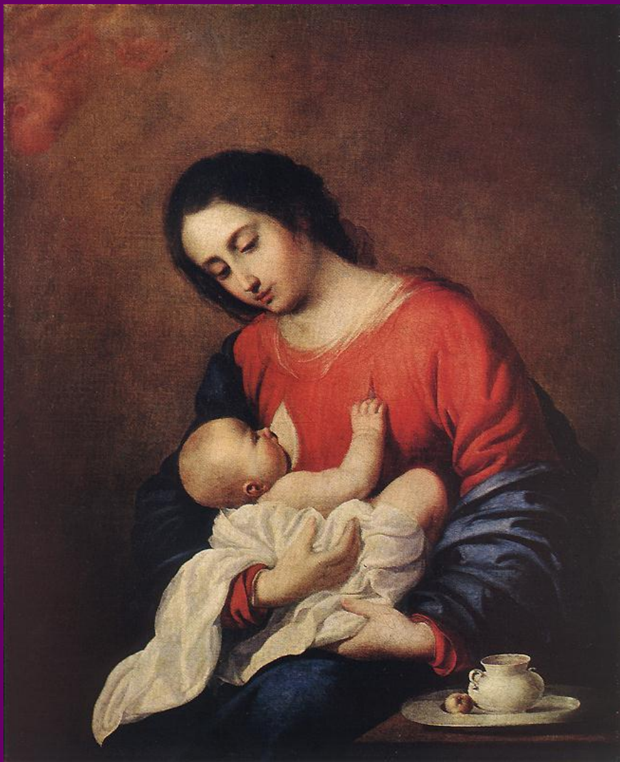
VL 101x78 h1658, del museo Pushkin (Moscú)... La clave es el sencillo bodegón.